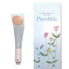
ピュアブル シャワーヘッド (ピンクホワイト) ……………税込 16,790円