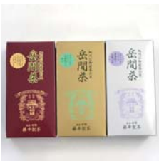
有機栽培 岳間茶ギフト .....税込 5,775円