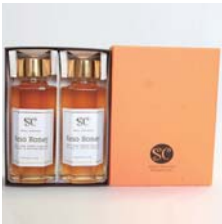
ナノハニー 国産蜂蜜 2本入……………税込 5,775円