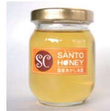
国産はちみつ れんげ 170g……………税込 1,575円