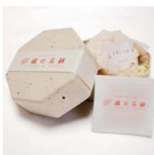
蠟燭白燭の石鹸 ギフト用 ……………税込 2,415円