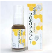
蜂の恵み プロポリス・スプレー ……………税込 2,940円