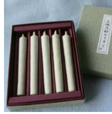
松山燭・和ろうそく .....税込 2,310円