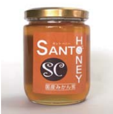
国産はちみつ みかん 300g……………税込 2,310円