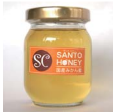
国産はちみつ みかん 170g……………税込 1,575円