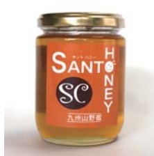
国産はちみつ 九州山野蜜 300g……………税込 2,205円