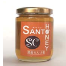
国産はちみつ れんげ 300g……………税込 2,310円