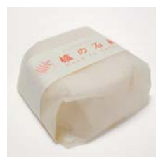
蠟燭白燭の石鹸 ……………税込 2,205円