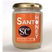
カナダ産はちみつ ホワイトクローバー 300g……………税込 1,995円