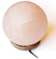
ソルトヒーリングランプ (球体タイプ) .....税込 8,400円