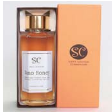
ナノハニー 国産蜂蜜 1本入……………税込 3,150円