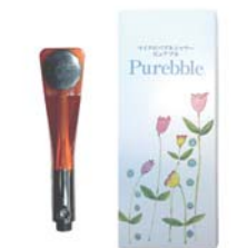
ピュアブル シャワーヘッド (ブラックブラウン) ……………税込 16,790円