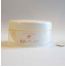
燭蠟ワックス .....税込 2,625円