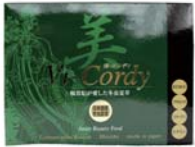
美コルディ .....税込15,750円