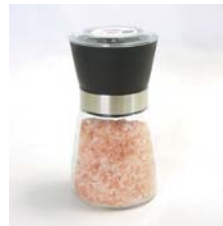
レッドソルト アンデス山脈の天然岩塩 .....税込 2,100円