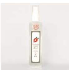
椿なのリペア(国産五島椿油) ナノローション 150ml……………税込 3,150円 入荷待ち