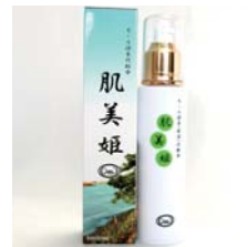
モール源泉(保湿)化粧水 肌美姫(きみひめ) ……………税込 3,800円