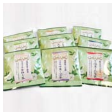
茶地藏 全国銘茶探訪 .....税込 3,675円