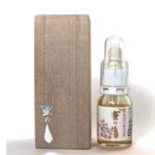
蜜のしずく 美肌エッセンス ……………税込 6,615円