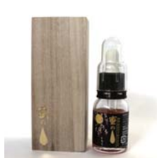
蜜のしずく 抗酸化エッセンス ……………税込 7,140円