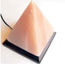
ソルトヒーリングランプ (ピラミッドタイプ) .....税込 8,400円