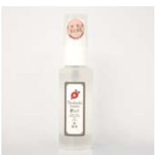
椿なのリペア(国産五島椿油) ナノローション 50ml……………税込 1,280円 入荷待ち