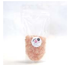
レッドソルト (詰め替え用) アンデス山脈の天然岩塩 .....税込 840円