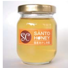
国産はちみつ あかしあ 170g……………税込 1,575円 入荷待ち