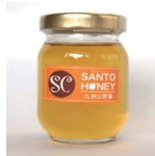
国産はちみつ 九州山野蜜 170g……………税込 1,470円