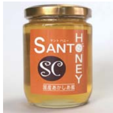
国産はちみつ あかしあ 300g……………税込 2,310円 入荷待ち