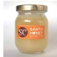
カナダ産はちみつ ホワイトクローバー 170g……………税込 1,365円