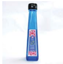
ローズウォーター コンセントレート .....税込 2,520円