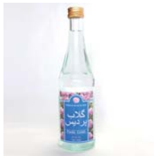
ローズウォーター クラシック .....税込 3,675円